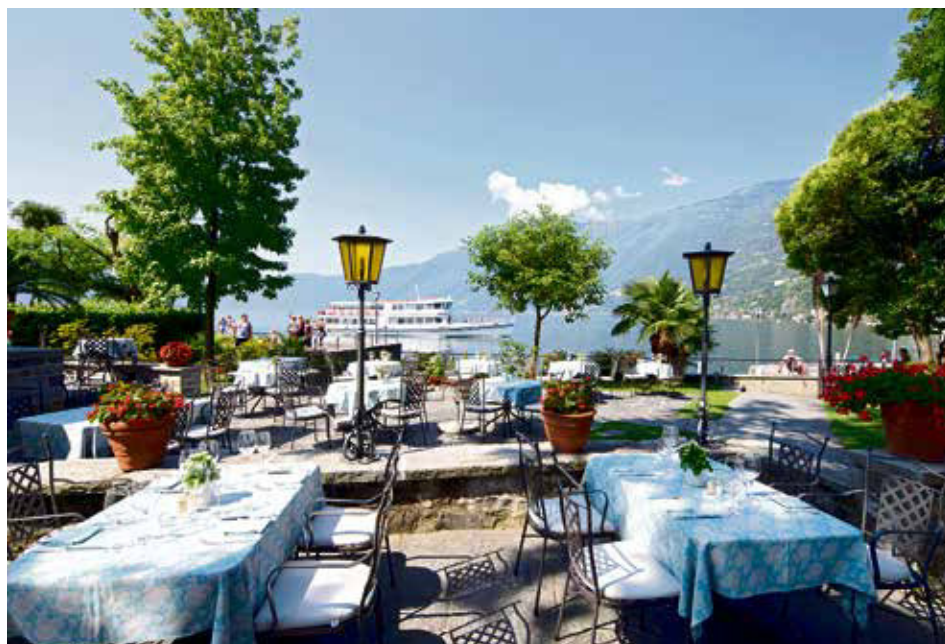
Vor dem Seeschloss in Ascona thront der Lago Maggiore und die prächtige Riviera.

Künstlerinnen wie Meret Oppenheim liessen sich hier nieder; in den 70er-Jahren machte eine Hippie-Kommune von sich reden. Der weitläufige Garten der Villa Carona ist ein idealer Ort, um die Seele baumeln zu lassen. Wenn dann der Blick auf das ausgezeichnete Restaurant La Sosta mit seiner Pergola fällt, wird manch einem in Gedanken an die nächsten kulinarischen Freuden das Wasser im Munde zusammenlaufen. RUPEN BOYADJIAN