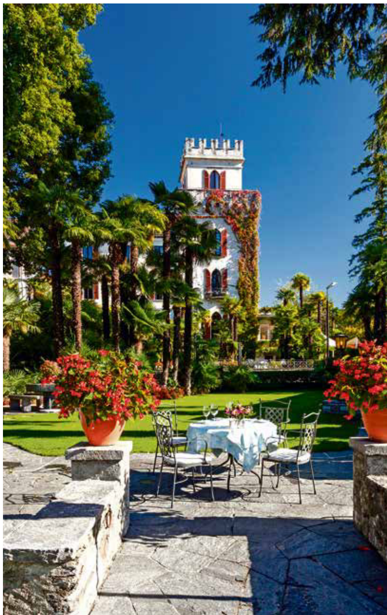
Hinter dem Schloss tut sich ein üppiger Garten auf, der die Hotelgäste verzaubert.